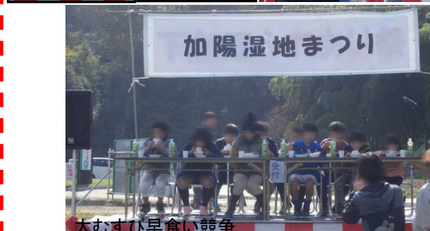
大むすび早食い競争

【参加した子どもたちの感想】 ボートの上から湿地や水鳥が見られて楽しかった。 生き物調査やボートが楽しかったので、また湿地で遊んでみたい。