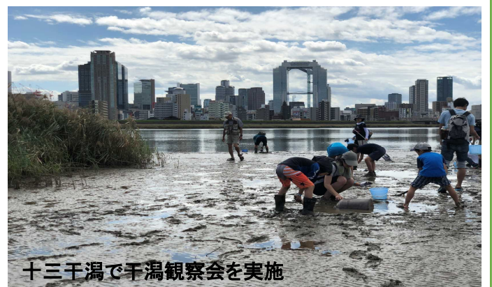
十三干潟で干潟観察会を実施

これまでの淀川アーバンキャンプの活動状況は 下記のFacebookからもご確認頂けます。 (URL: https://www.facebook.com/YodogawaUC/ )