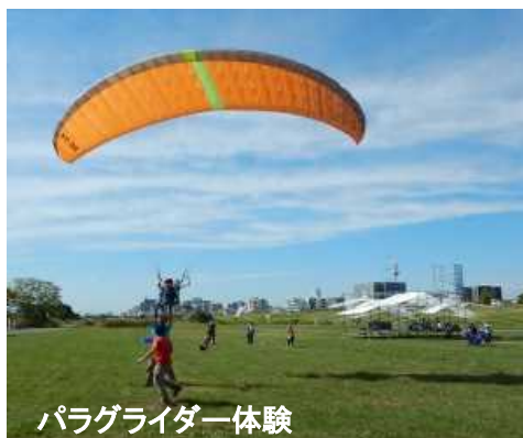
パラグライダー体験