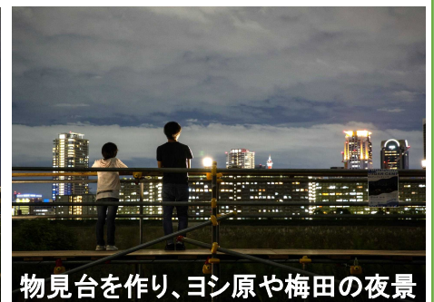
物見台を作り、ヨシ原や梅田の夜景