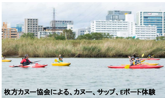
枚方カヌー協会による、カヌー、サップ、Eボート体験