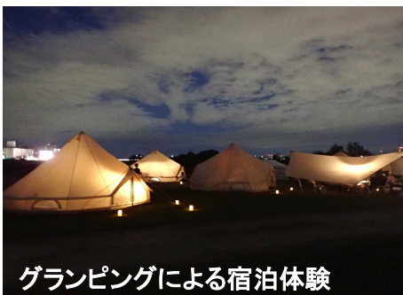
グランピングによる宿泊体験