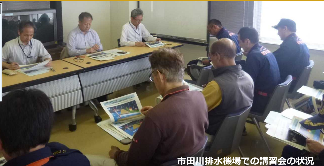
市田川排水機場での講習会の状況

紀南河川国道事務所では、樋門・水門等の河川管理施設の操作を確実に行うため、5月29日(水)に事務所・新宮市・紀宝町・操作員の合同による『操作訓練』を行いました。訓練前には講習会を開催し、操作や情報伝達の方法について確認を行いました。