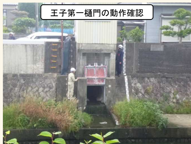
王子第一樋門の動作確認