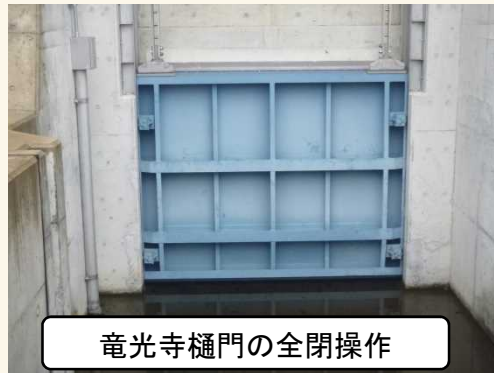
竜光寺樋門の全閉操作