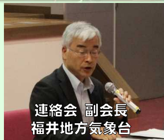
連絡会 副会長 福井地方気象台