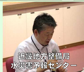
近畿地方整備局 水災害予報センター