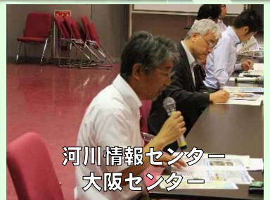
河川情報センター 大阪センター