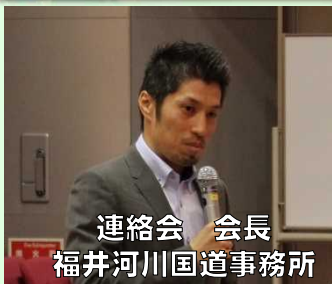
連絡会 会長 福井河川国道事務所

日時：令和元年6月12日（水）10:00～11:30 場所：福井県産業情報センター マルチホール