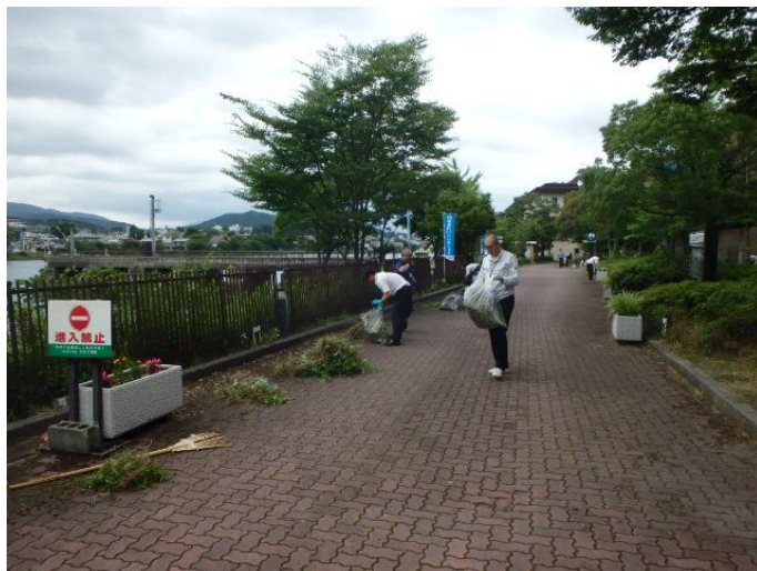
旧洗堰周辺の清掃活動を行いきれいになりました！