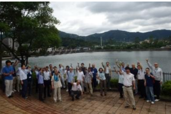
瀬田川洗堰をバックに乾杯！