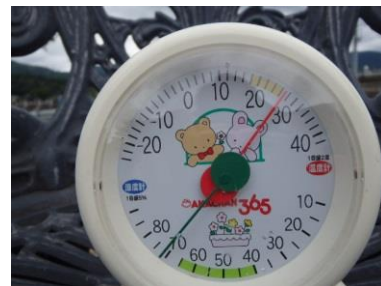
涼しくなりました