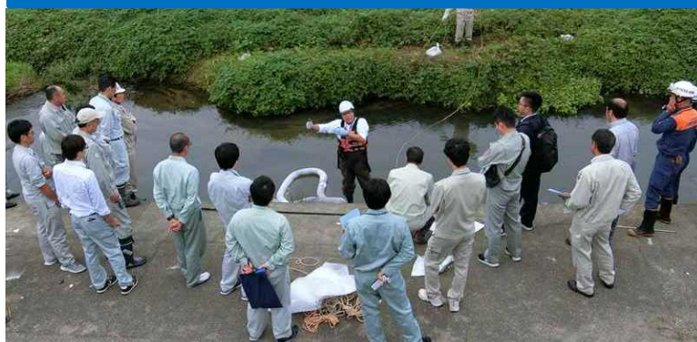
効率的に油を回収する方法を教わりました