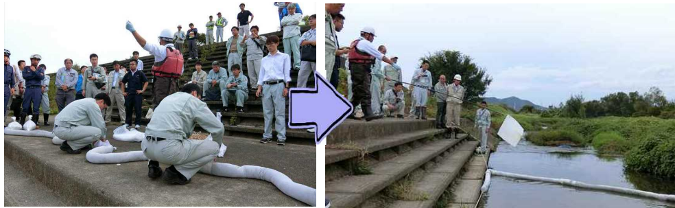
実際にオイルフェンスを設置してもらい、オイルマットで流出油を回収するまでを体験