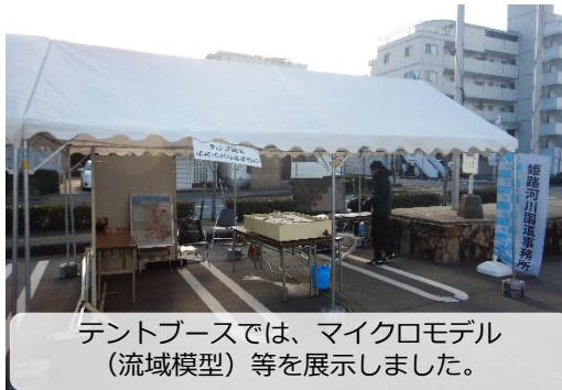
テントブースでは、マイクロモデル（流域模型）等を展示しました。