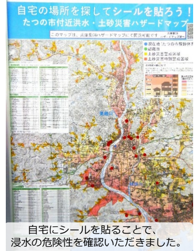
自宅にシールを貼ることで、浸水の危険性を確認いただきました。