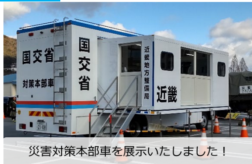
災害対策本部車を展示いたしました！