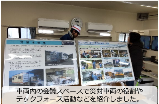
車両内の会議スペースで災対車両の役割やデッキフォース活動などを紹介しました。