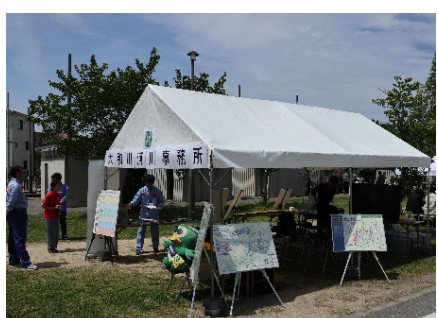
大和川河川事務所ブース