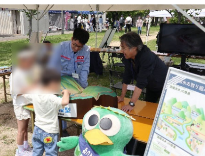
流域治水模型で実験