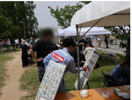
水質や清掃活動のパネル展示

【実施結果・今後について】 ・実際に模型で実験した子供たちからは「大和川の取り組みに興味を持てた」等の声があり、遊びながら学べる内容に楽しんでいる様子が見られました。 ・意識調査では子供たちや若い世代を中心に参加いただき、動物に例えることで楽しみながら学び防災意識の定着に一定の効果をもたらすことを実感しました。 ・今後も大和川河川事務所では、地域と連携しながら防災や環境学習の機会を提供していく予定です。