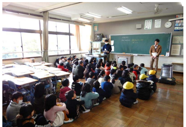
最上階（3階）の各教室へ避難完了