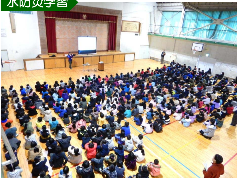
大雨から命を守る行動について学習