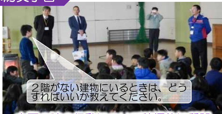
2階がない建物にいるときは、どうすればいいか教えてください。