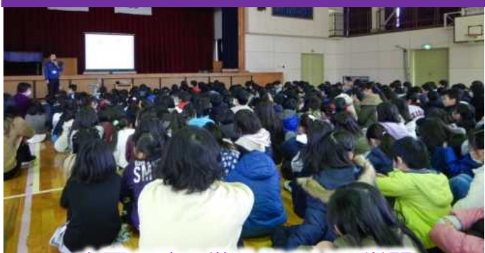
大雨の時の備えについて学習