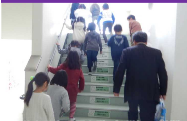
洪水発生！最上階（3階）へ避難