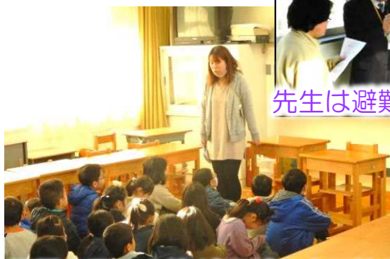
先生は避難状況を確認