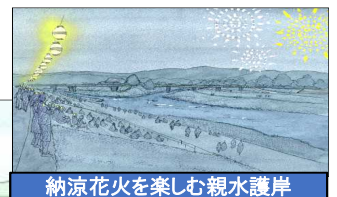
納涼花火を楽しむ親水護岸