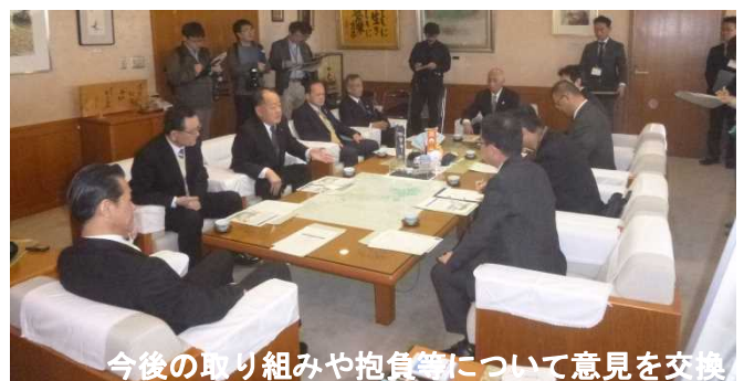
今後の取り組みや抱負等について意見を交換

河川改修に合わせ、地域・民間等の様々な「知恵」を活かした「名張かわまちづくり」を進めて頂くことで、地域発展の推進力になることを期待したい