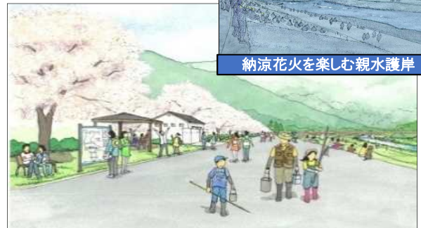
新緑の山並みと季節を愛でる桜並木