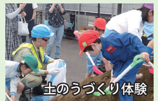
土のうづくり体験