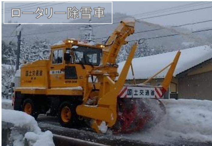
ロータリー除雪車