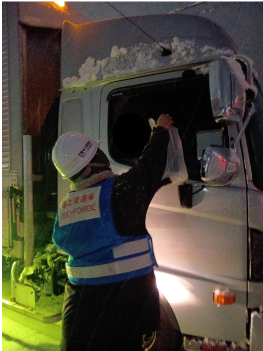
ドライバーへ食料等を提供