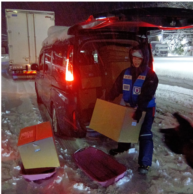
ドライバーへ食料等を配布するための準備