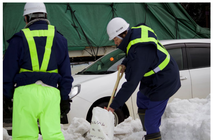
赤崎地区において、交通開放後、 雪を溶かすため、塩化カルシウムを散布