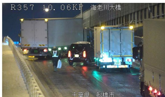
冬用タイヤやチェーン未装着車両による スリップ事故