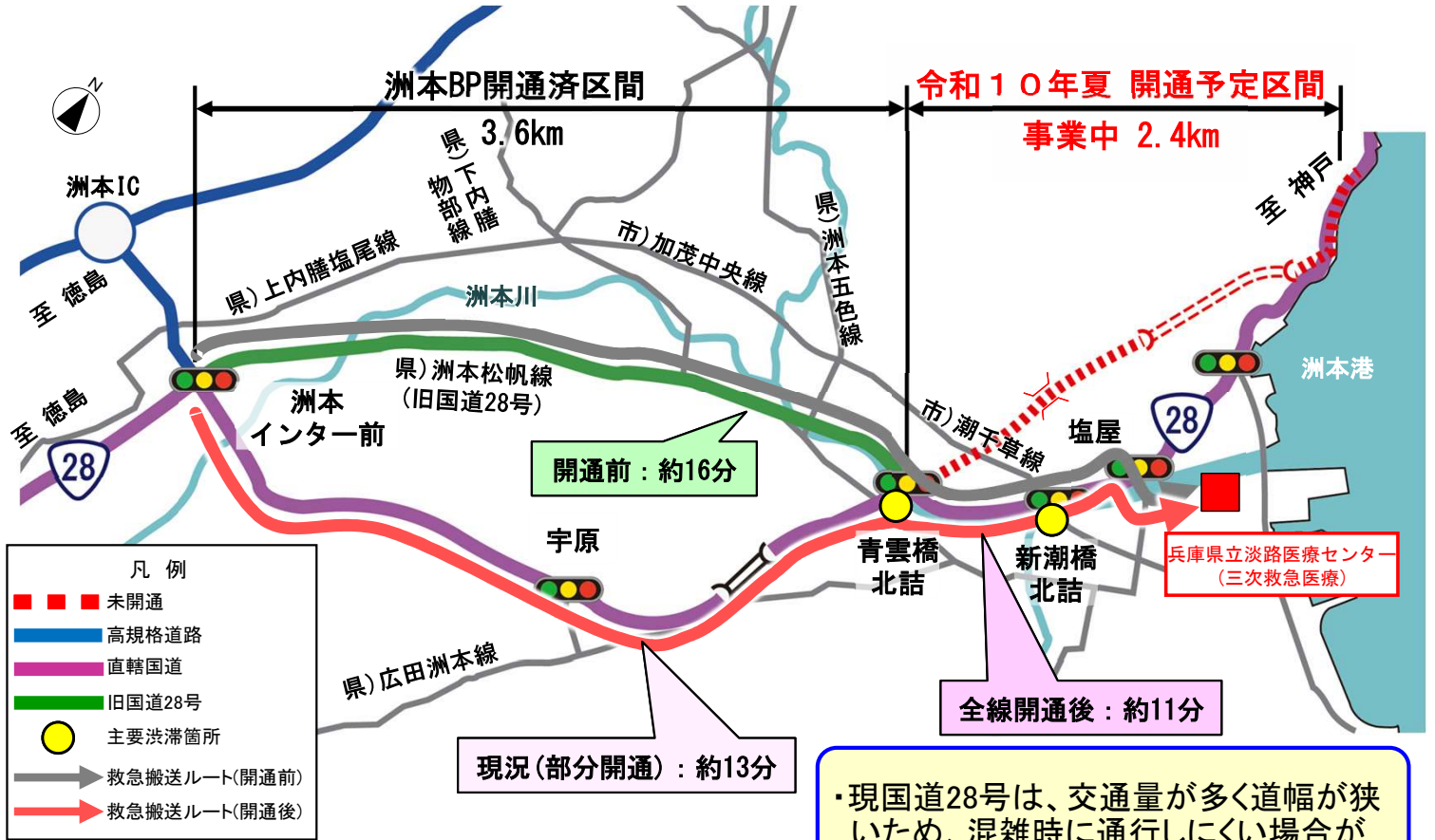
〈洲本IC前交差点～淡路医療センター〉