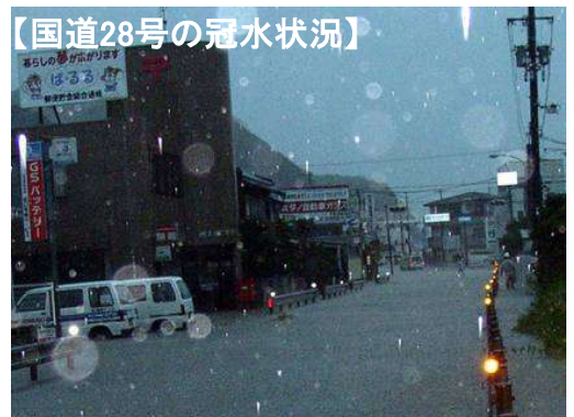
写真① (平成16年10月20日撮影)