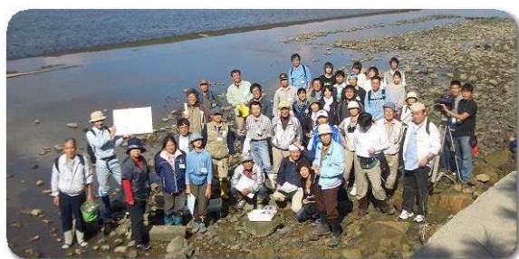
【参考：これまでの調査状況】