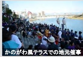
かのがわ風テラスでの地元催事