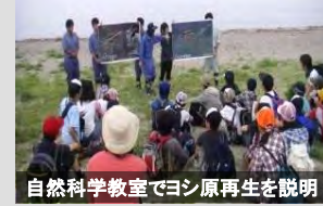
自然科学教室でヨシ原再生を説明