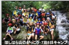
ほしはら山のがっこう 7泊8日キャンプ