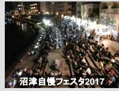
沼津自慢フェスタ2017