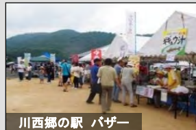
川西郷の駅 パザー