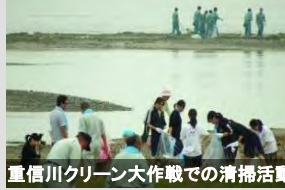
重信川クリーン大作戦での清掃活動