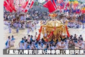
「風治八幡宮川渡り神幸祭」(番田河原)