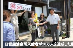
旧坂越浦会所入館者が20万人を達成した瞬間