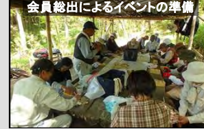
会員総出によるイベントの準備