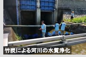
竹炭による河川の水質浄化