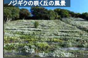
ノジグクの咲く丘の風景