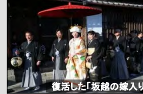
復活した「坂越の嫁入り」