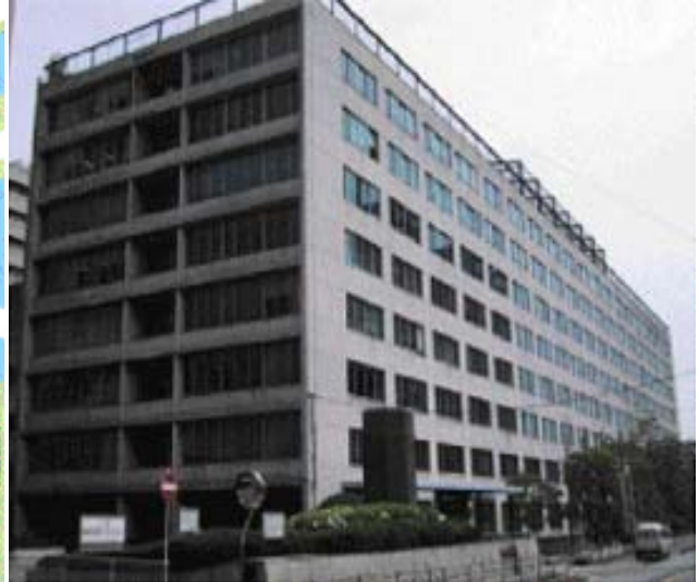
大阪合同庁舎第1号館