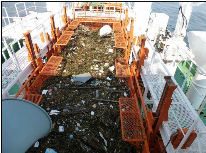
26日漂流物回収状況