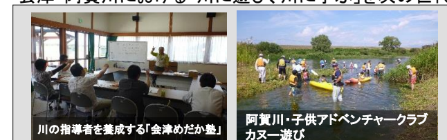
川の指導者を養成する「会津めだか塾」