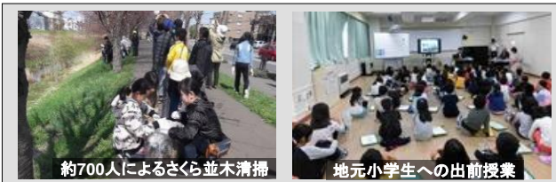
約700人によるさくら並木清掃