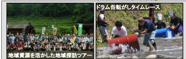
地域資源を活かした地域探訪ツアー