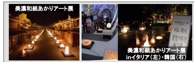
美濃和紙あかりアート展