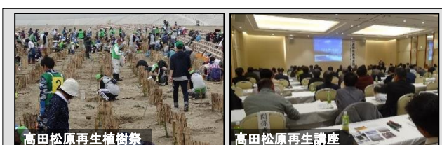
高田松原再生植樹祭