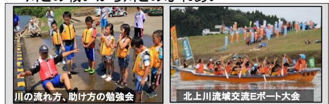
川の流れ方、助け方の勉強会