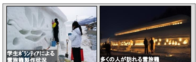
学生ボランティアによる雪旅籠製作状況