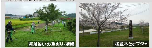
河川沿いの草刈り・清掃