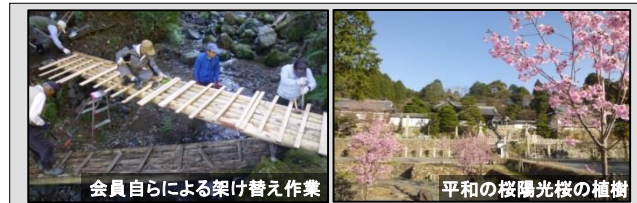
会員自らによる架け替え作業