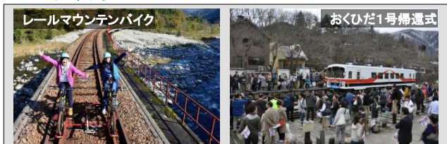
レールマウンテンバイク