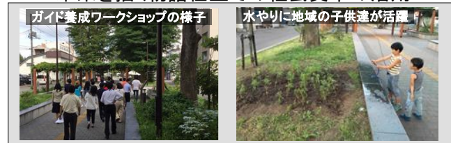
ガイド養成ワークショップの様子