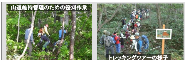
山道維持管理のための笹刈作業