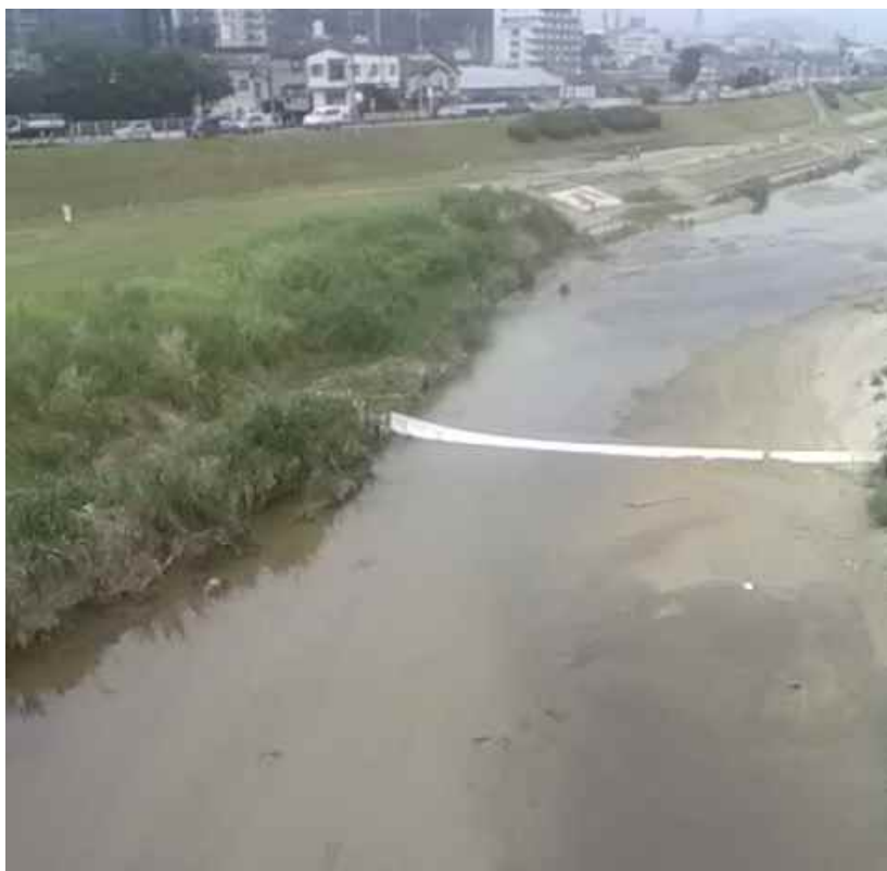
オイルフェンス設置状況（石川橋上流）

利水等への影響はないが、大事を取ってオイルフェンス設置済。 本事象による魚等のへい死は無い。