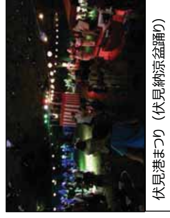
伏見港まつり（伏見納涼盆踊り）