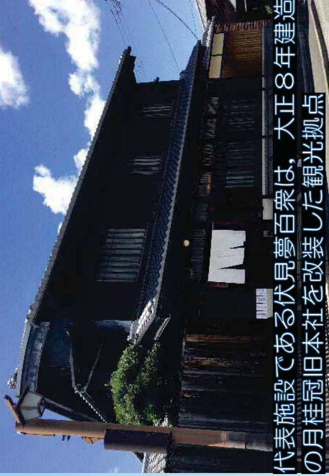
代表施設である伏見夢百衆は、大正8年建造の月桂冠旧本社を改装した観光拠点

水とともに歩んで400年 歴史の転換を担った みなとまち・伏見の魅力をご紹介します！