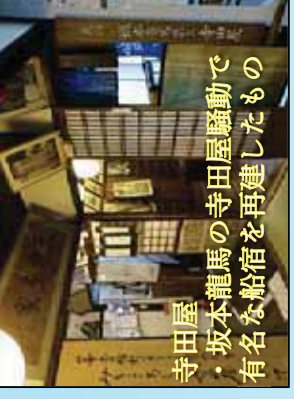
寺田屋 ・坂本龍馬の寺田屋騒動で有名な船宿を再建したもの