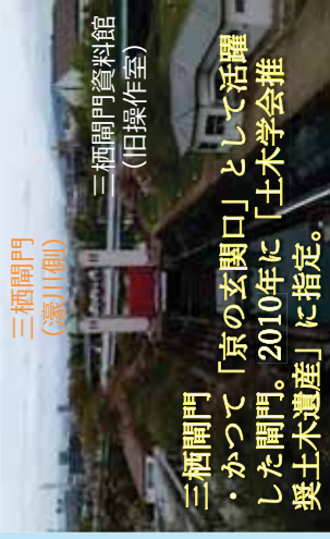
三栖閘門 ・かつて「京の玄関口」として活躍した閘門。2010年に「土木学会推奨土木遺産」に指定。