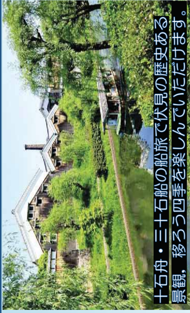
十石舟・三十石舟の船旅で伏見の歴史ある景観、移ろう四季を楽しんでいただけます。