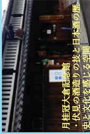
月桂冠大倉記念館 ・伏見の酒造りの技と日本酒の歴史と文化を感じる空間