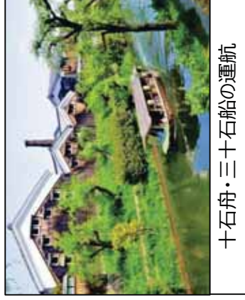
十舟・三十石船の運航