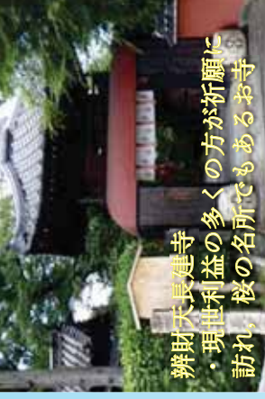
辨財天長建寺 ・現世利益の多くの方が祈願に訪れ、桜の名所でもあるお寺