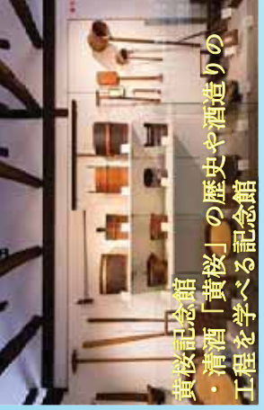
黄桜記念館 ・清酒「黄桜」の歴史や酒造りの工程を学べる記念館