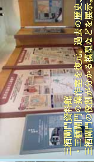
三栖閘門資料館 ・三栖閘門の操作室を復元。過去の歴史、三栖閘門の役割が分かる模型などを展示。