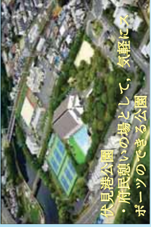
伏見港公園 ・府民憩いの場として、気軽にスポーツのできる公園