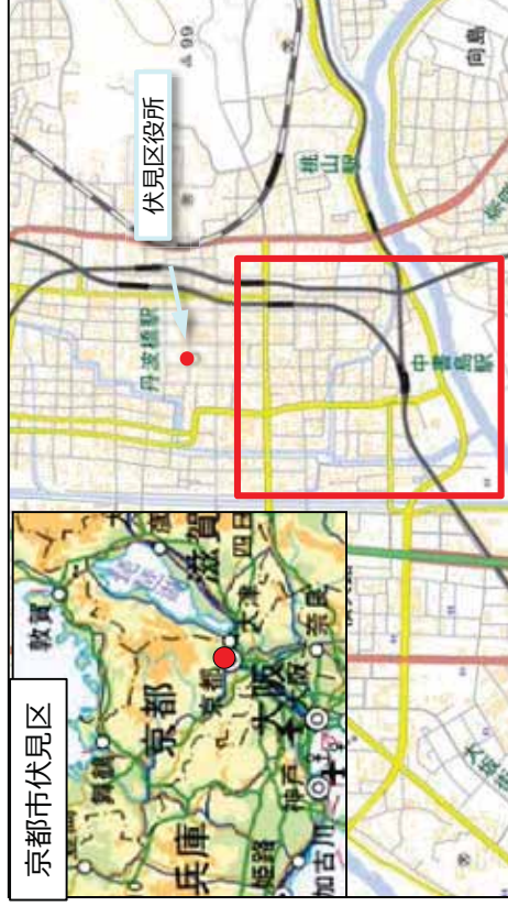
国土地理院地図（電子国土Web）（ https://maps.gsi.go.jp ）をもとに国土交通省作成