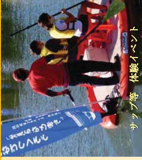
サップ等 体験イベント