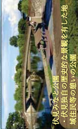
伏見みなと公園 ・伏見独自の歴史的な景観を有した地域住民等の憩いの公園