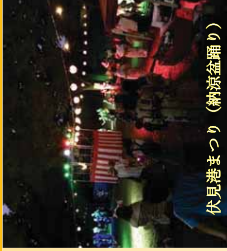
伏見港まつり（納涼盆踊り）