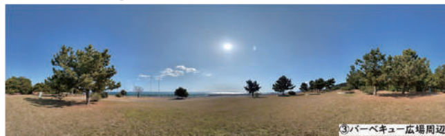
③バーベキュー広場周辺