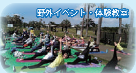
野外イベント・体験教室