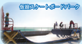
仮設スケートボードパーク