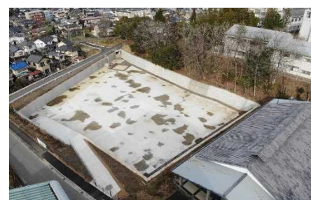
桃池調整池新設(福知山市)