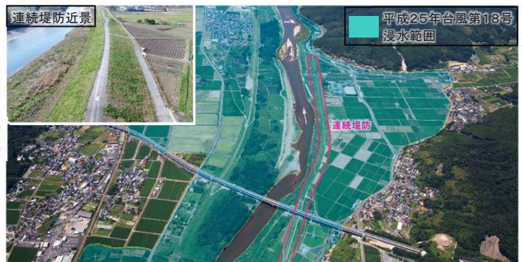
緊急治水対策(綾部市私市地区)