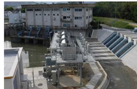
法川排水機場増強(国土交通省)