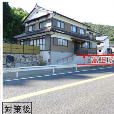
緊急治水対策(福知山市日藤・下天津地区)