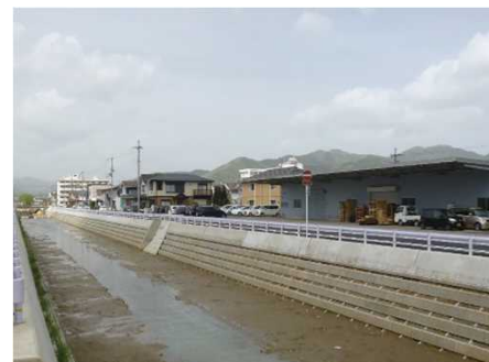
弘法川河川改修(京都府)