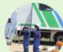
デッキフォース子供体験