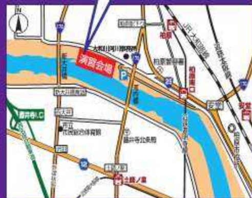
JR 柏原駅から徒歩10分、近鉄釜崎寺橋柏原南口駅から徒歩5分