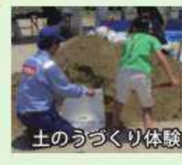
土のうづくり体験