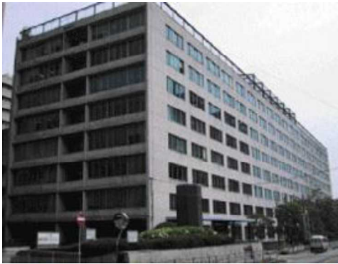
大阪第一地方合同庁舎