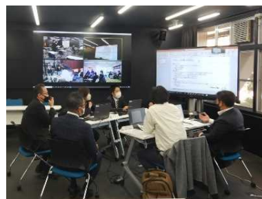
グループ討議 (アクティブラーニング)