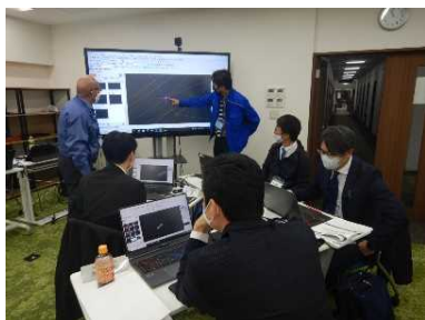
3D-CAD ソフトを用いた 演習