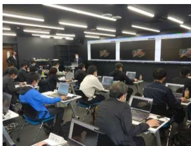
3D-CAD ソフトを用いた 実習