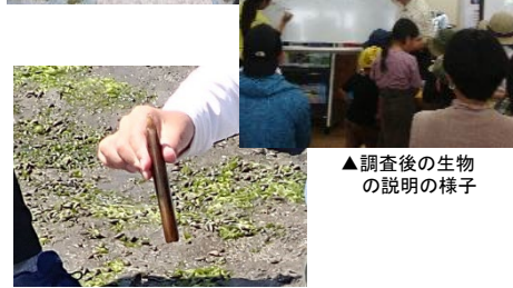
▲阪南2区造成干潟で採取した生き物(マテガイ)