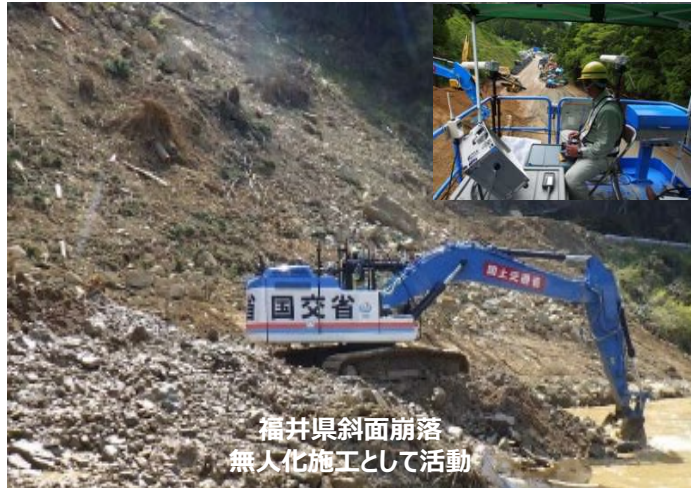
福井県斜面崩落 無人化施工として活動