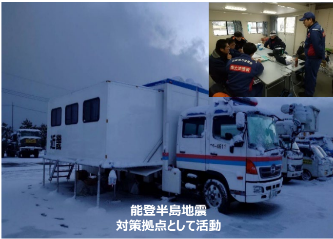
能登半島地震 対策拠点として活動