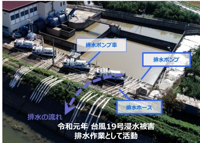
排水の流れ 令和元年 台風19号浸水被害 排水作業として活動