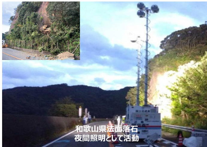
和歌山県法面落石 夜間照明として活動