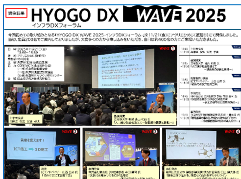
取組事例：HYOGO DX WAVE 2025