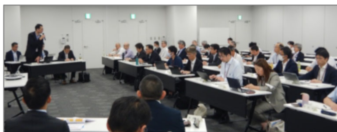
昨年度開催の様子 (場所：大手前合同庁舎)