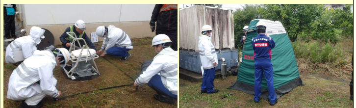
仮設トイレの組立