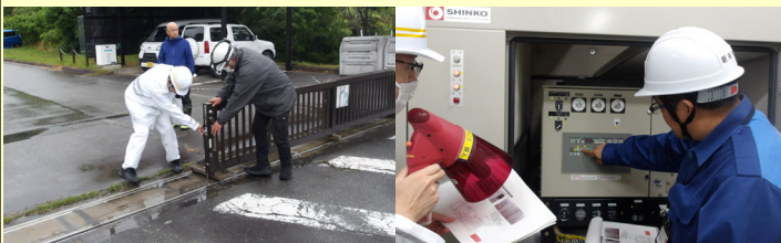
非常用ゲートの開閉