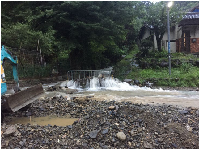
令和3年8月(国道1号 滋賀県大津市)

最新の気象情報及び道路情報等に注意し、十分な時間的余裕を持って行動いただくとともに、必要に応じて運行計画の変更をお願いいたします。