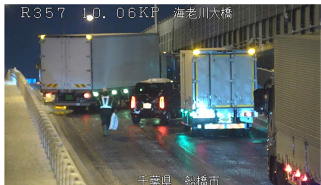
冬用タイヤやチェーン未装着車両による スリップ事故