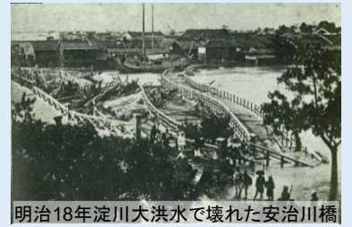
明治18年淀川大洪水で壊れた安治川橋