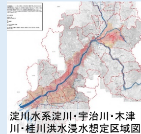
淀川水系淀川・宇治川・木津川・桂川洪水浸水想定区域図