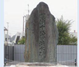
明治18年洪水碑(枚方市)

よどがわ 淀川にある、昔の水害の被害やそのときの人々の様子が 書かれた石碑について調べてみよう。