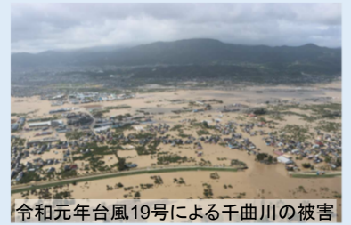
令和元年台風19号による千曲川の被害

最近も、全国各地で水害が発生しています。大雨が降って 洪水が起きるとどうなるのか調べてみよう。