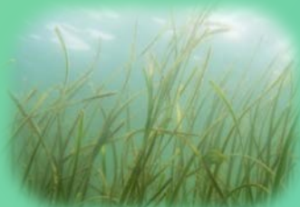
せんなん里海公園のアマモ

脱炭素社会、地球温暖化対策の切り札！？ 今注目を集めるブルーカーボンの最新情報！ 2050年二酸化炭素排出実質ゼロは実現できる？ 大阪湾再生とブルーカーボンの関係は？