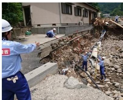
河川被害状況の調査