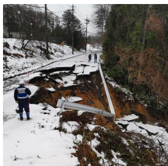
道路被害状況の調査