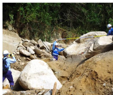
土砂災害被害状況の調査