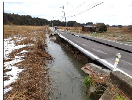
—被災状況（亀裂・水路損傷）