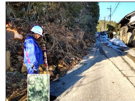
—被災状況（土砂崩れ）—