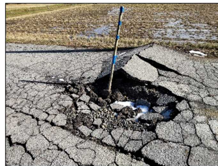
—被災状況（路面隆起・陥没）—