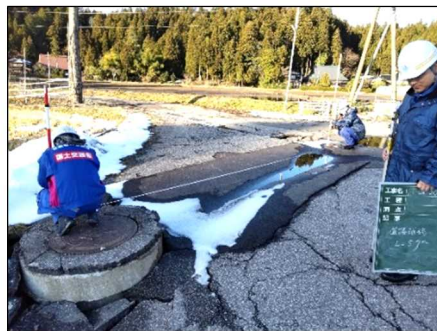
—被災状況（マンホール隆起）—