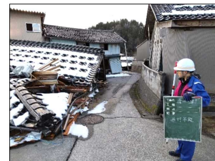
—被災状況（家屋倒壊）—