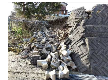
—被災状況（擁壁崩壊）—