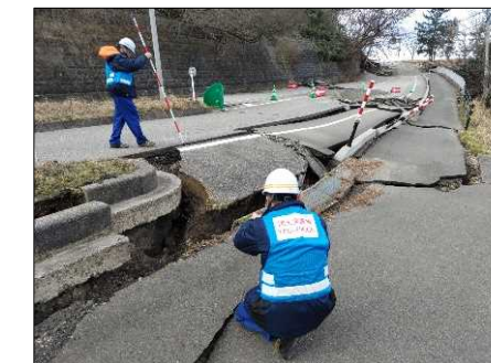
—被災状況（路面段差）—