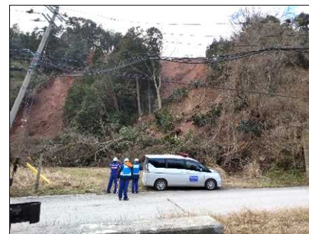
—被災状況（土砂崩落）—