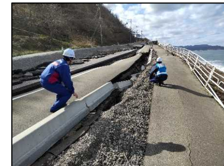
—被災状況（道路の隆起）—