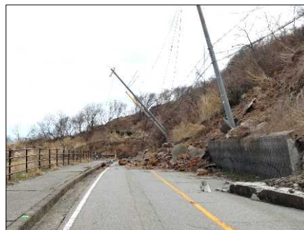
—被災状況（土砂崩落）—