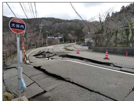
—被災状況（舗装損壊）—