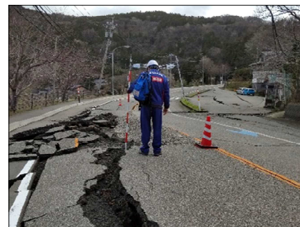
—被災状況（舗装損壊）—