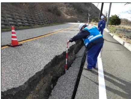
—被災状況（路面段差）—