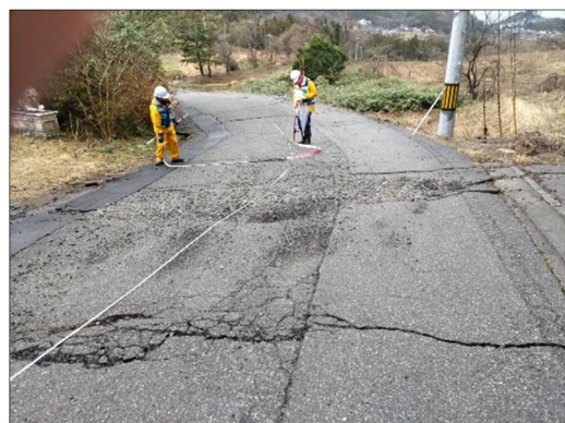
—被災状況（舗装損壊）—