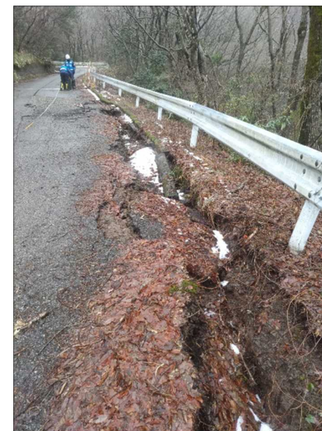
—被災状況（路肩損壊）—