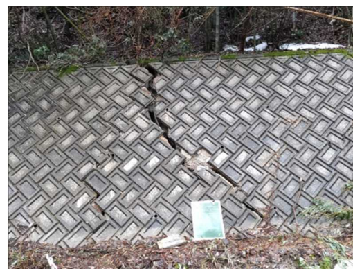
—被災状況（擁壁損壊）—