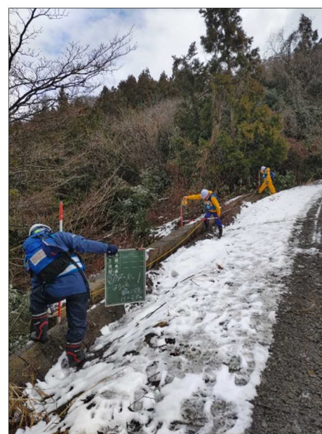
—被災状況（路肩損壊）—