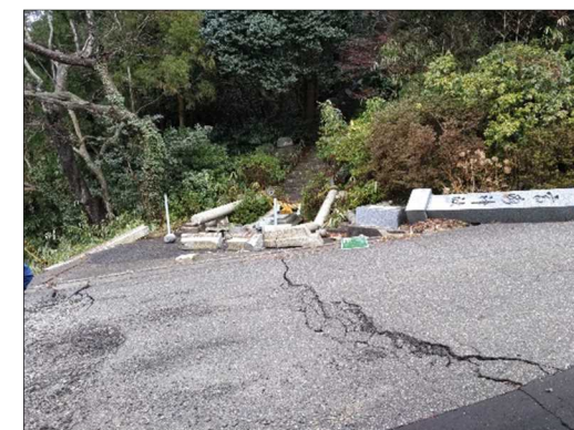
—被災状況（石柱倒壊）—