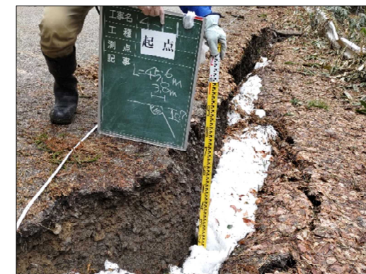
—被災状況（路面段差）—