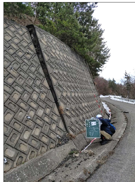
—被災状況（擁壁損壊）—