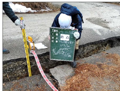
—被災状況（路面段差）—