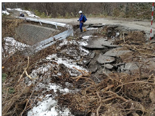
—被災状況（舗装損壊）—