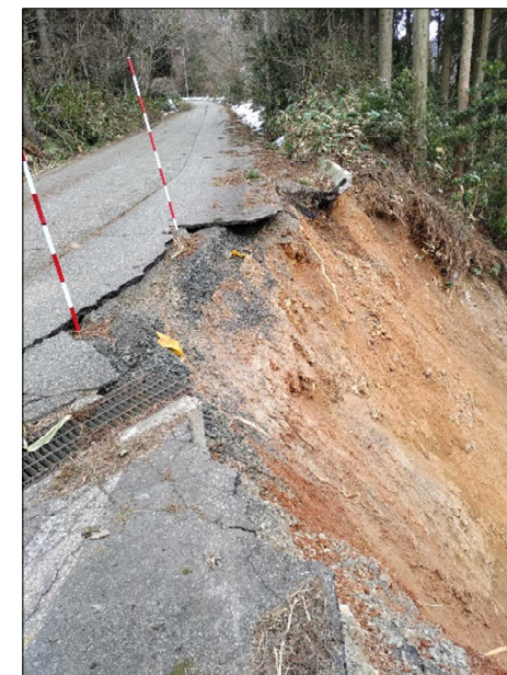
—被災状況（法面崩壊）—