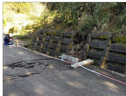
—被災状況（擁壁損壊）—