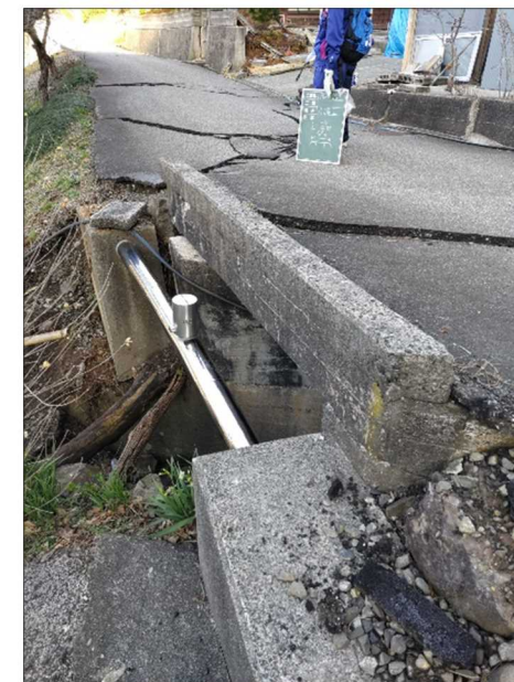
—被災状況（路面損壊）—