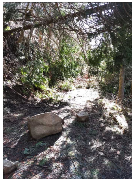
—被災状況（土砂崩落）—