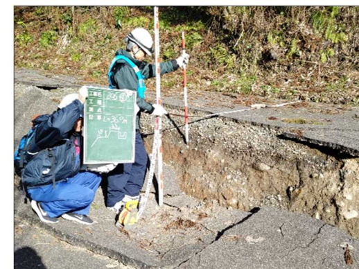
—被災状況（路面段差）—