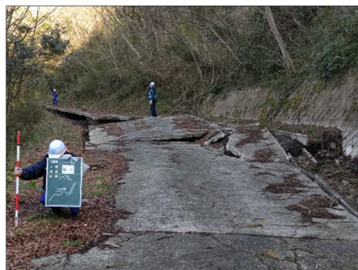
—被災状況（路面損壊）—