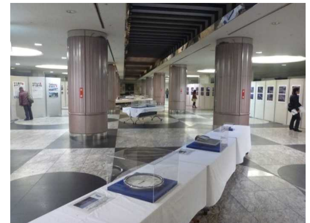
パネル展開催状況