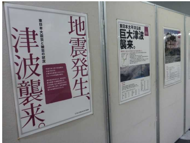
東日本大震災パネル

大阪国道事務所では、平成25年1月7日(月)～31日(木)まで、JR北新地駅すぐ東の曾根崎地下歩道内で、「災害の教訓を忘れない」と題したパネル展を開催しています。本パネル展では、災害への備え、災害発生時の対応、応援体制、復旧、復興への取組等のパネル展示に併せ、東日本大震災で被災した標識等のモニュメント(実物)も展示しています。2月からは豊岡、京都、紀南管内の「道の駅」でも展示を行う予定です。