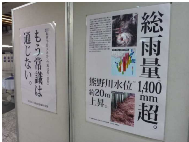
紀伊半島大水害パネル