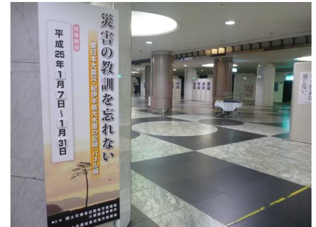
パネル展開催状況