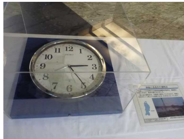
津波到達時刻で止まった時計