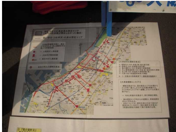
訓練用交通規制図