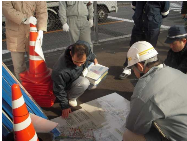
国道26号での交通規制訓練状況