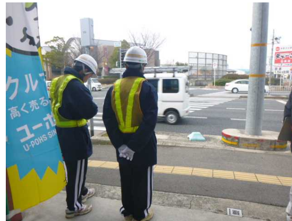
不法占用指導の体験