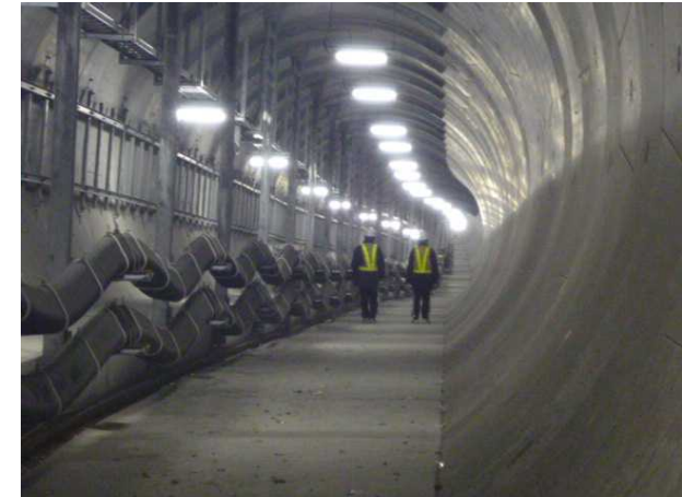
共同溝の点検作業