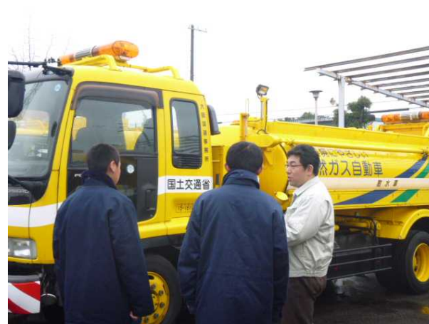
道路パトロールカー等についての説明