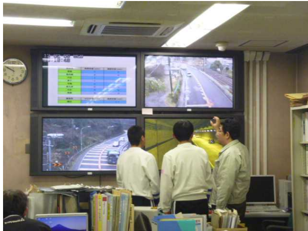
道路管理についての説明

平成25年2月5日(水)からの2日間、泉大津市立誠風中学校の生徒2名が、南大阪維持出張所での職場体験学習に参加しました。国土交通省の出張所で行う道路管理についての説明を聞いた後、実際にパトロールしながら、共同溝の点検作業をしたり、不法占用指導の体験をしたり、橋梁補修工事の現場見学等を行いました。また、最終日には学生が目線で交差点改良の計画を作成し、職員等の前で発表を行いました。