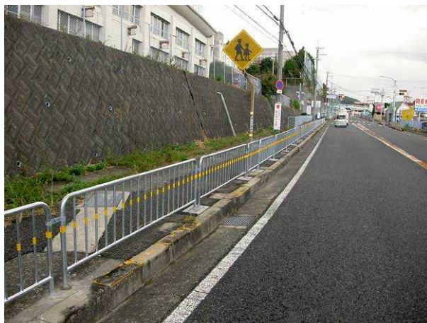
新しくなった歩道柵