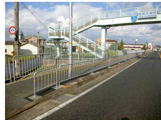
歩道橋前も新しくなりました