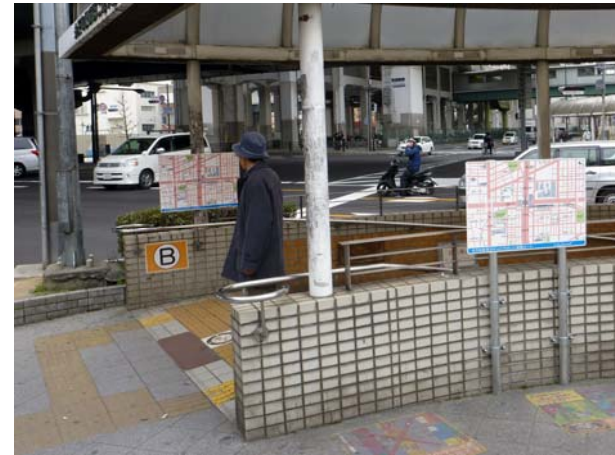
案内マップの設置 (地下道出入口部)