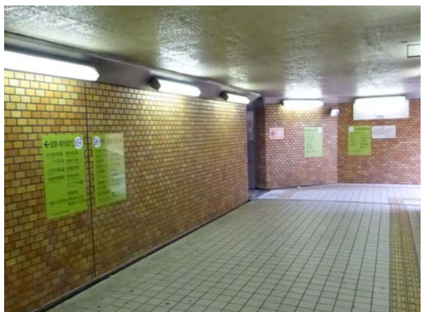
行先案内板の設置 (地下道内)