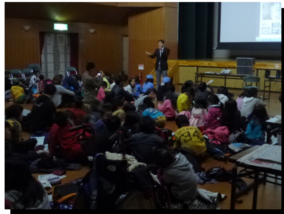
地域調整課長から説明

平成25年12月26日、西淀川区内の小学生を対象に行われたあおぞら財団主催の「空気のごれを調べてみよう」イベントにおいて、小学生の皆さん（参加者：小学生72人、大人15人）に西淀川区の道路環境について（大気汚染の状況、原因、行政の取組みなど）説明させていただきました。