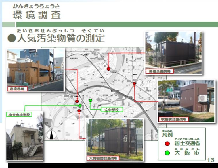
大気環境状況の把握