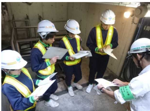
浪速第一共同溝点検随行