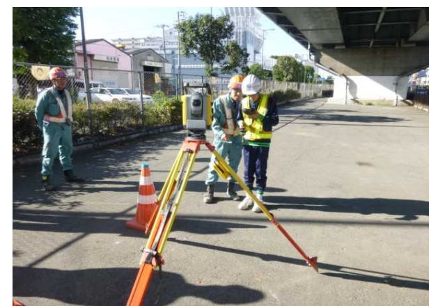
トータルステーション実体験