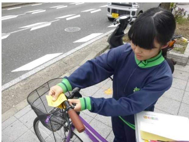
放置自転車エフ貼り