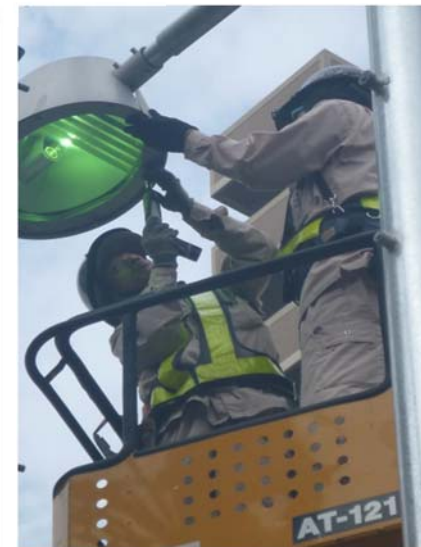
ランプ交換作業状況